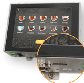
Noir et inox