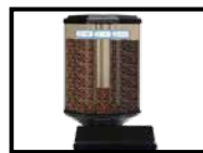
Contenant à grains allongé