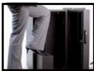
Bahuts de bois