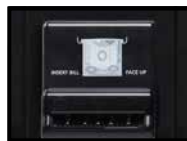
Accepteur de billets